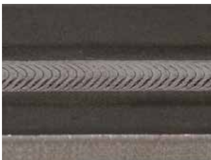
Плазма заваряване на титанови сплави