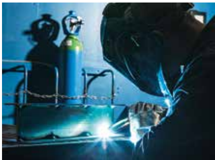
МИГ заваряване на алуминий

Високоэффективна защита при ВИГ и МИГ заваряване на всички материали