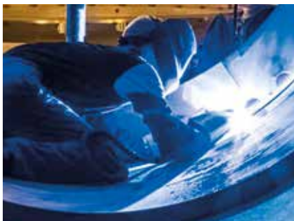
ВИГ заваряване на неръждаща стомана